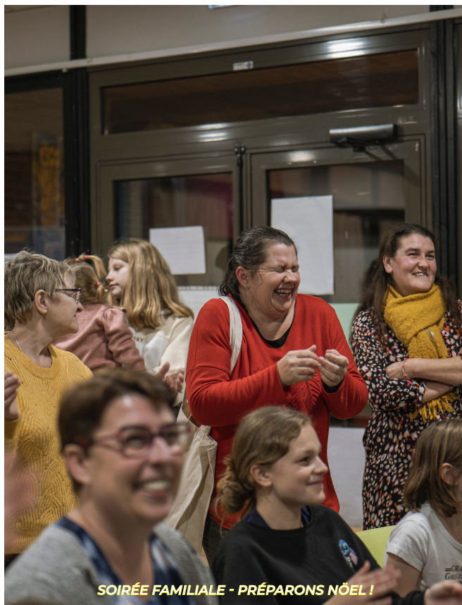
SOIRÉE FAMILIALE - PRÉPARONS NOËL !