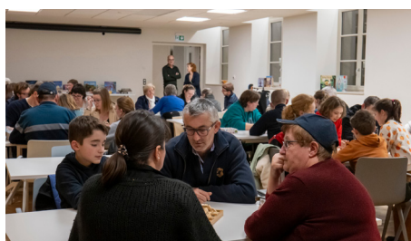
Soirée Jeux de Société

Nous ne pouvons pas conclure ce résumé sans mentionner la partie administrative, essentielle au bon fonctionnement de l'organisation. Le renouvellement de l'équipe administrative (accueil, comptabilité et secrétariat) a occasionné des bouleversements, mais nous voyons le bout du tunnel. Ces nouvelles règles nous permettront de mieux gérer l'Espace SocioCulturel de la Lys et de mieux répondre à vos attentes et à celles de nos partenaires et financeurs.